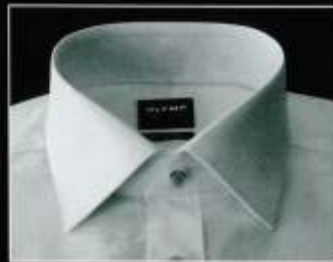
Italian Kent Italian Kent Italian Kent