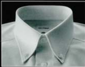
Button-Down Button-down Pointes boutonnées