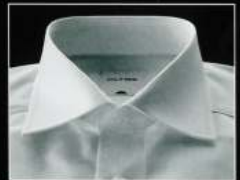
Haifisch Cutaway Italien