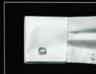
Umschlag Double Mousquetaire