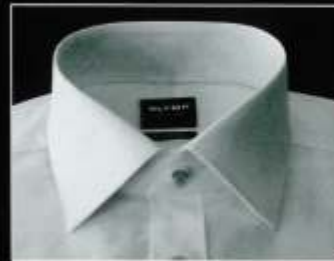
New York Kent New York Kent New York Kent