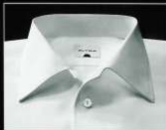
Elbe Elbe Elbe