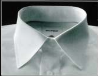
Kent Kent Kent